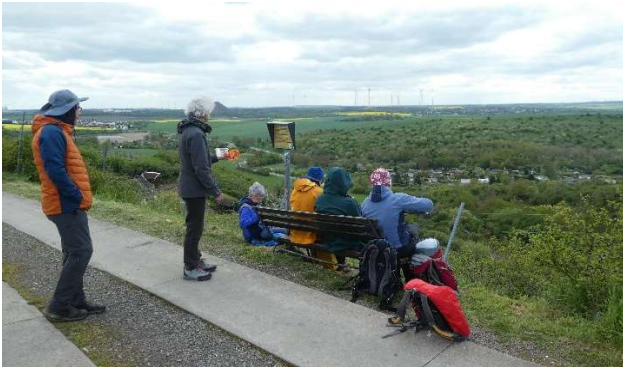
Rast am Panoramablick vor Höhnstedt