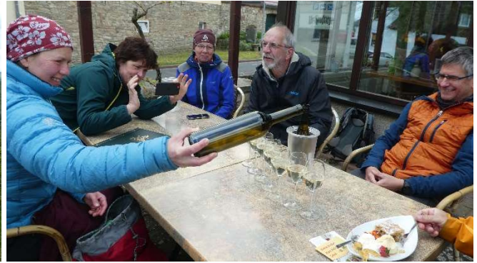
Weinprobe an der „Weintraube“ Höhnstedt

Über Rollsdorf, wo sich Winzer auf die Öffnung von Straußenwirtschaften am 1. Mai vorbereiteten, ging es nach Seeburg am Süßen See. Hier gönnten wir uns erneut eine Rast am Café „Haus am See“.