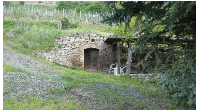
Winzerhütte bei Rollsdorf

Weiter ging es an der Südküste des Sees nach Aseleben. Ab hier mussten wir uns sputen, um den Zug in Röblingen zu erreichen. Leider auf der Fahrstraße L176, ohne Fußweg. Einige Reste des ehemaligen „Salzigen See“ säumten den Weg. Am Bahnhof angekommen, stellten wir fest, wir hätten nicht so schnell laufen müssen, die Regionalbahn und auch die S-Bahn hatten 15 Minuten Verspätung. Die Regionalbahn brachte uns schließlich zurück nach Halle, von wo aus jeder den Weg wieder in sein Zuhause nahm.