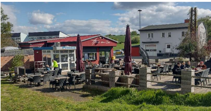
„Haus am See“ Seeburg

Weiter ging es an der Südküste des Sees nach Aseleben. Ab hier mussten wir uns sputen, um den Zug in Röblingen zu erreichen. Leider auf der Fahrstraße L176, ohne Fußweg. Einige Reste des ehemaligen „Salzigen See“ säumten den Weg. Am Bahnhof angekommen, stellten wir fest, wir hätten nicht so schnell laufen müssen, die Regionalbahn und auch die S-Bahn hatten 15 Minuten Verspätung. Die Regionalbahn brachte uns schließlich zurück nach Halle, von wo aus jeder den Weg wieder in sein Zuhause nahm.