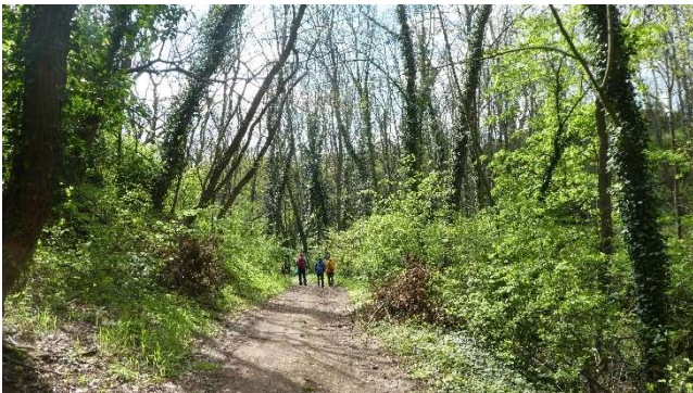
Romantisches Rösetal bei Höhnstedt

Über Rollsdorf, wo sich Winzer auf die Öffnung von Straußenwirtschaften am 1. Mai vorbereiteten, ging es nach Seeburg am Süßen See. Hier gönnten wir uns erneut eine Rast am Café „Haus am See“.